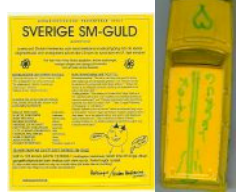
Ovan syns en modell av Gurgelkottmobilen. Nedan: den riktiga Gurgelkottmobilen!