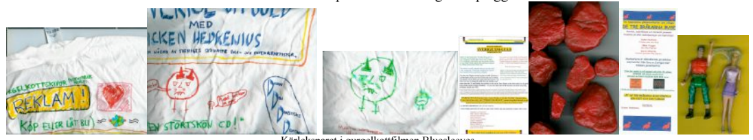
Kärleksparet i gurgelkottfilmen Bluesleaves Härnedan är Gurgelkotthund